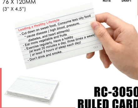
RC-3050 RULED CARD