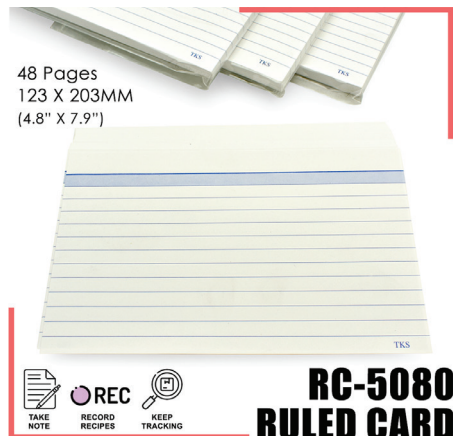
RC-5080 RULED CARD