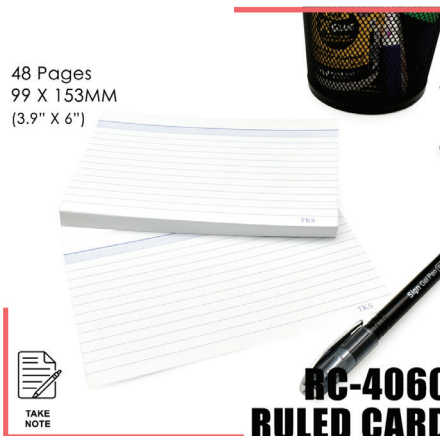
RC-4060 RULED CARD